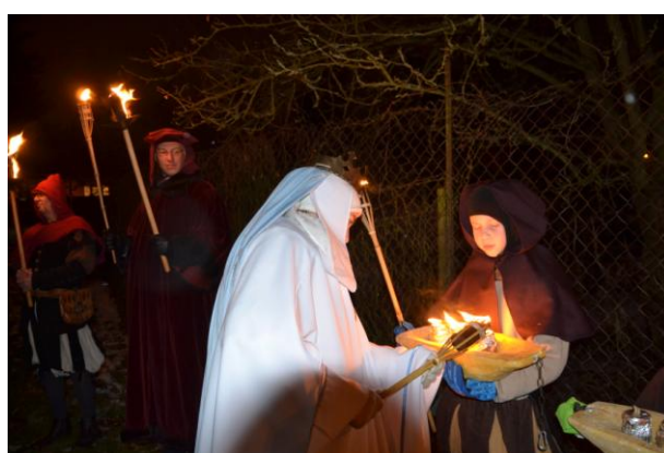
Sv. Barbora zapaluje hornické troky