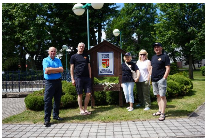
Cestou ze setkání návštěva Hory sv. Šebastiána a Štoly Marie Pomocné v Měděnci v Krušných horách