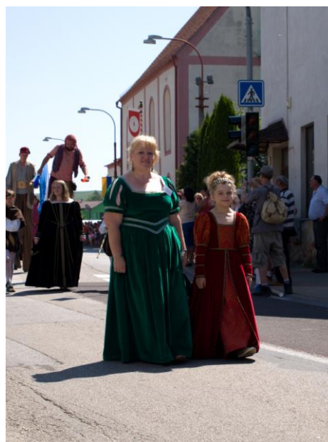
Slavnostní průvod městem