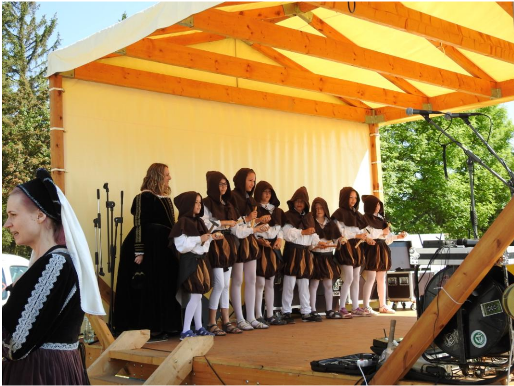
Zahájení slavností – tradiční tanec permoníků v podání dětí ze ZŠ Rudolfov