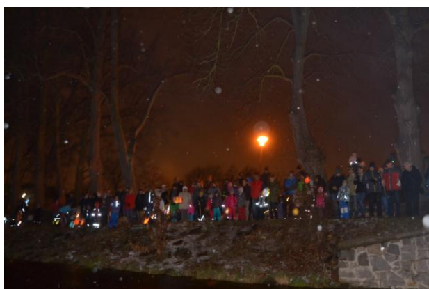
Hráz Královského rybníka