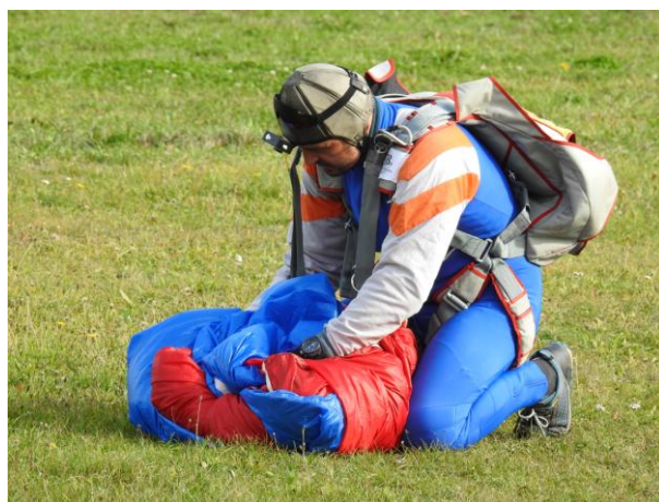
Historicky první seskok parašutistů na Farskou louku