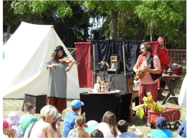
Na návštěvníky čekal bohatý kulturní program