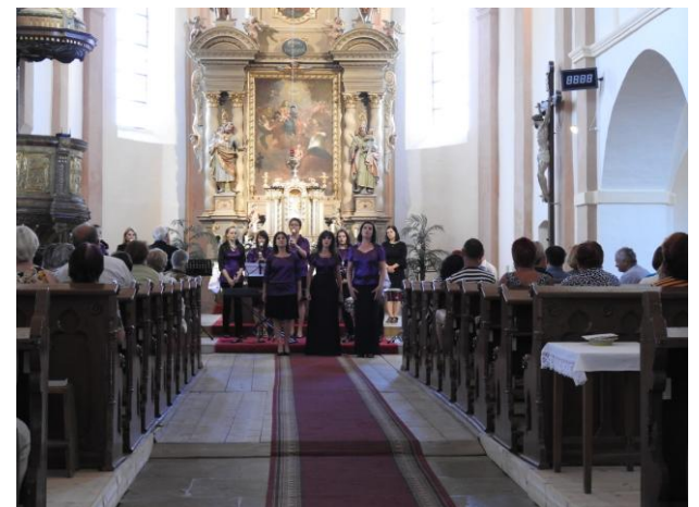
Tradiční vystoupení Třeboňských Pištců