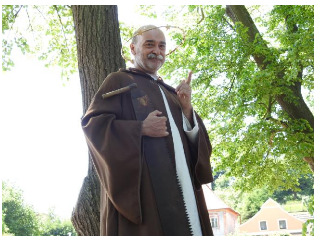
Rudolfovský Karlův most