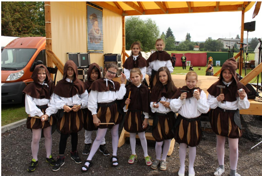
Zahájení slavností – tradiční tanec permoníků v podání dětí ze ZŠ Rudolfov