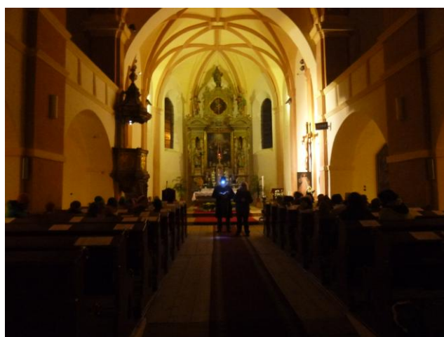
Navštívili jsme kostel sv. Víta, kde děti poslouchaly Hornickou pohádku