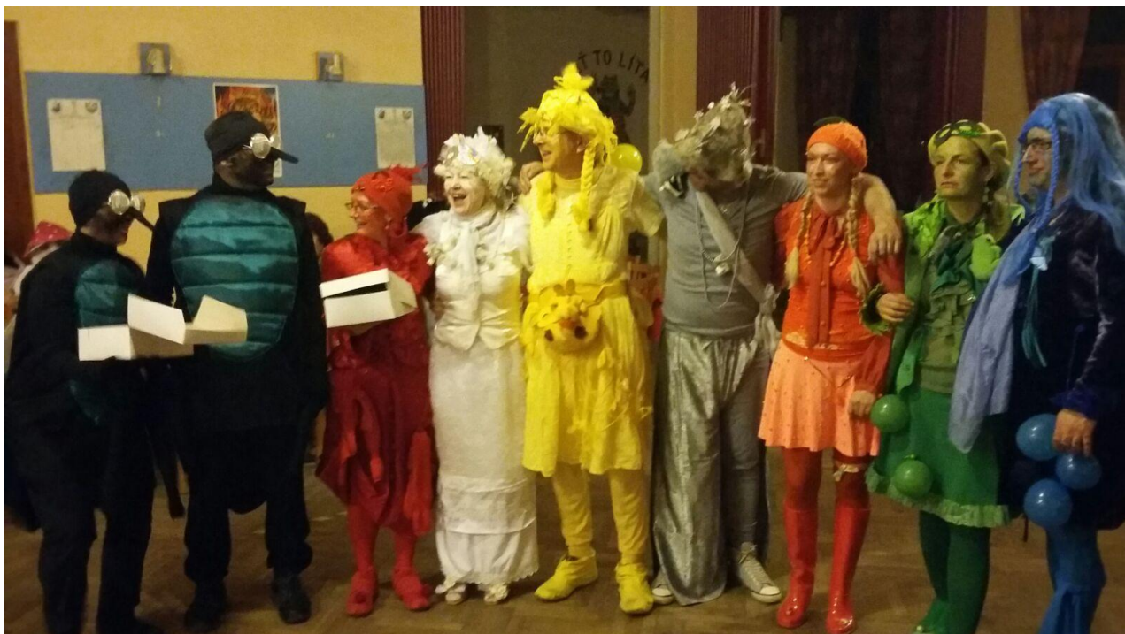
Vyhlášení nejhezčí masky

Ples se v Dubičném koná již jedenáctým rokem. V Dubičném se koná kvůli chybějícímu vhodnému prostoru v Rudolfově. Na akci členové SPR chodí v obci Rudolfov a Dubičné zvat osobně, což zajistí informovanost o akci a také peníze za prodané vstupenky. V letošním roce se pomocí osobního zvaní podařilo získat 8 030Kč. Přímo na akci se prodalo 24 vstupenek za 50Kč. Na akci zahrála kapela Hastroš.