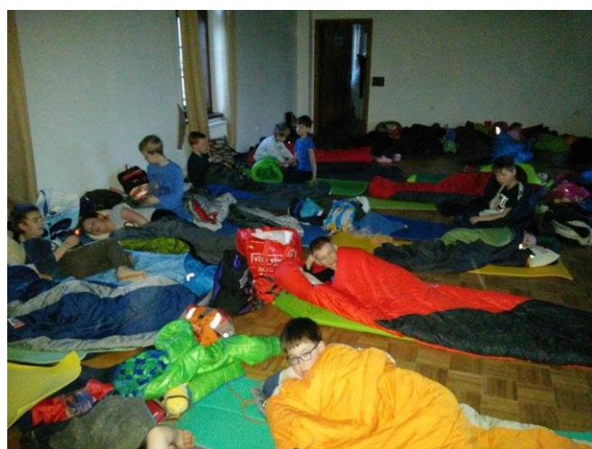
Nocování v multifunkčním sále Hornické muzea