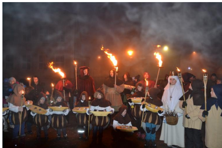
Sv. Barbora s malými permoníky