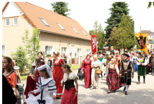
V letošním roce byla opět velká účast kostýmovaných lidí, za což jim velice děkujeme.