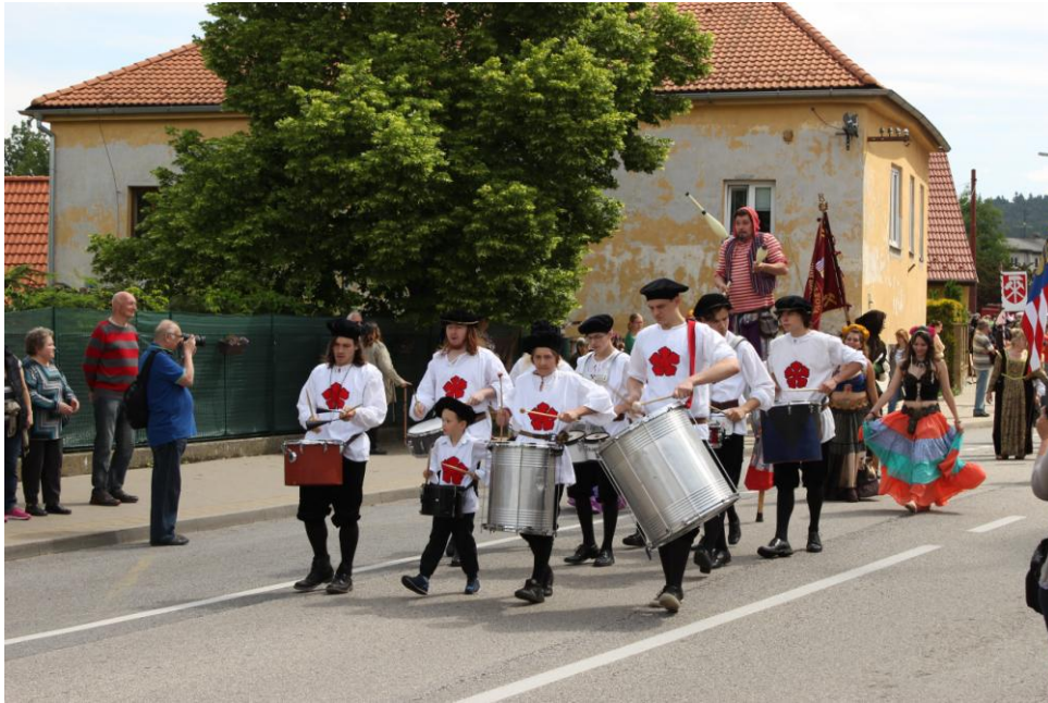
Bubenická skupina Wild Sticks v čele průvodu