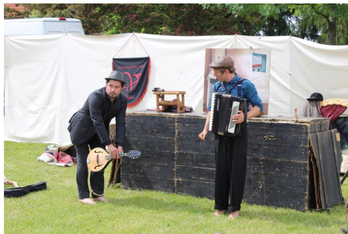
Divadlo Já to jsem