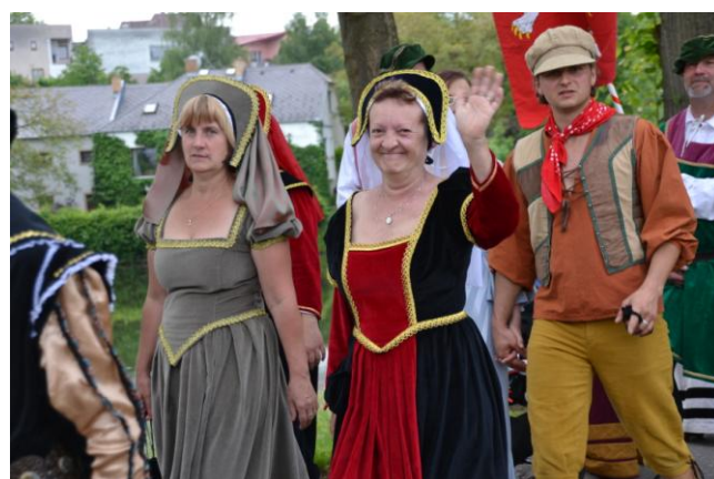
Hornické slavnosti 2017 jsou již v přípravě