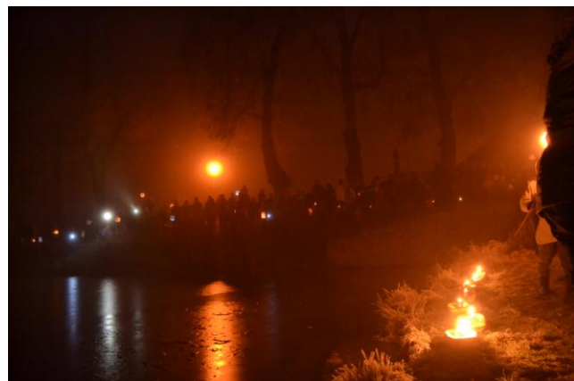
V letošním roce jsme lodičky kvůli zamrzlému rybníku nepouštěli